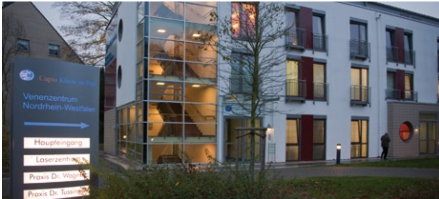
Cadio Klinik im Park: Die Venenspezialisten in Hilden.

Viele Menschen sind mit zunehmendem Alter unzufrieden mit ihrem Erscheinungsbild. Neben dem Gesicht sind die Hände eine der „Visitenkarten“, die das wahre Alter offenbaren.